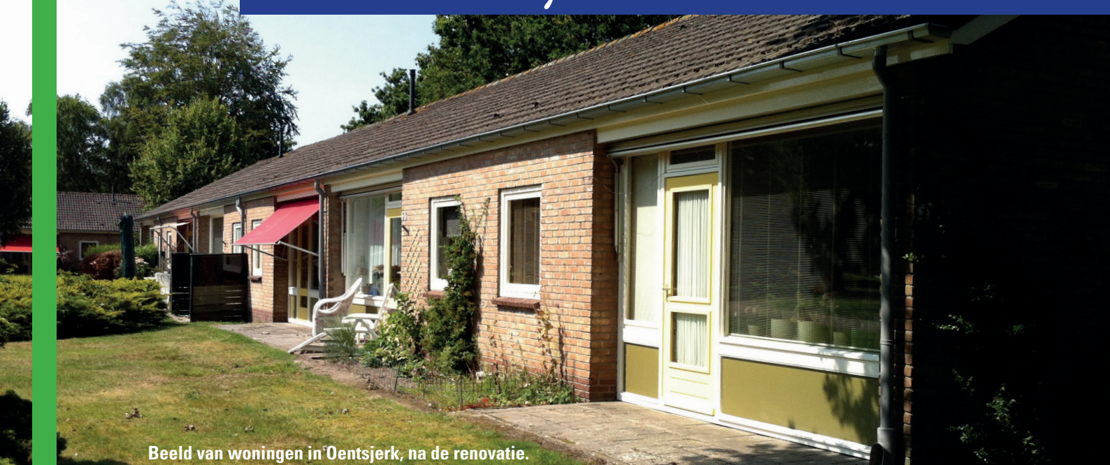
Beeld van woningen in Oentsjerk, na de renovatie.