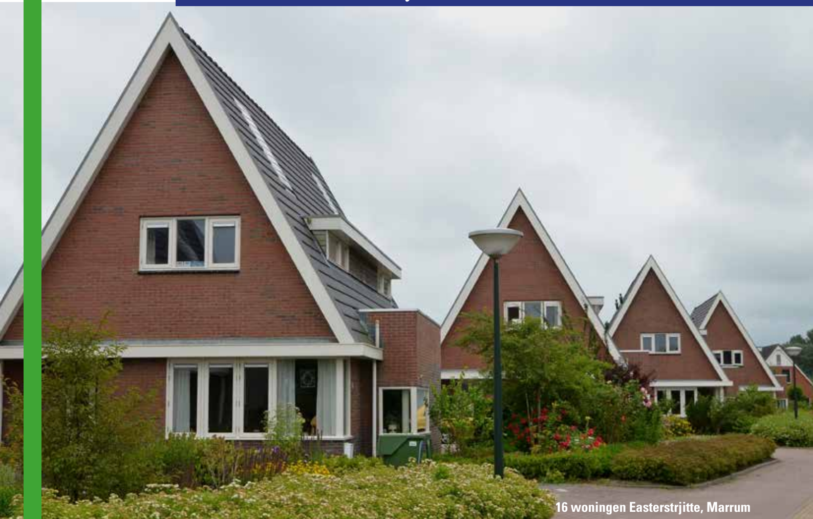
16 woningen Easterstrjitte, Marrum